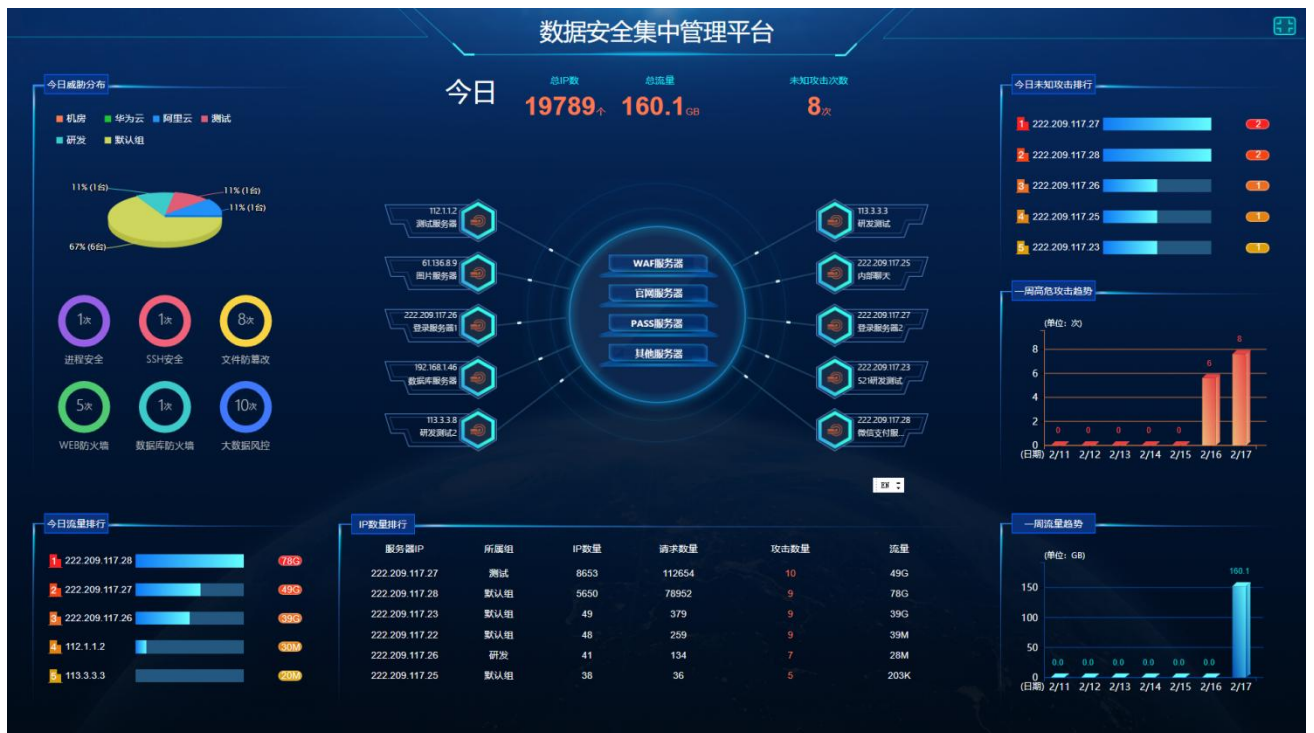
分布式版集中管控大屏首页